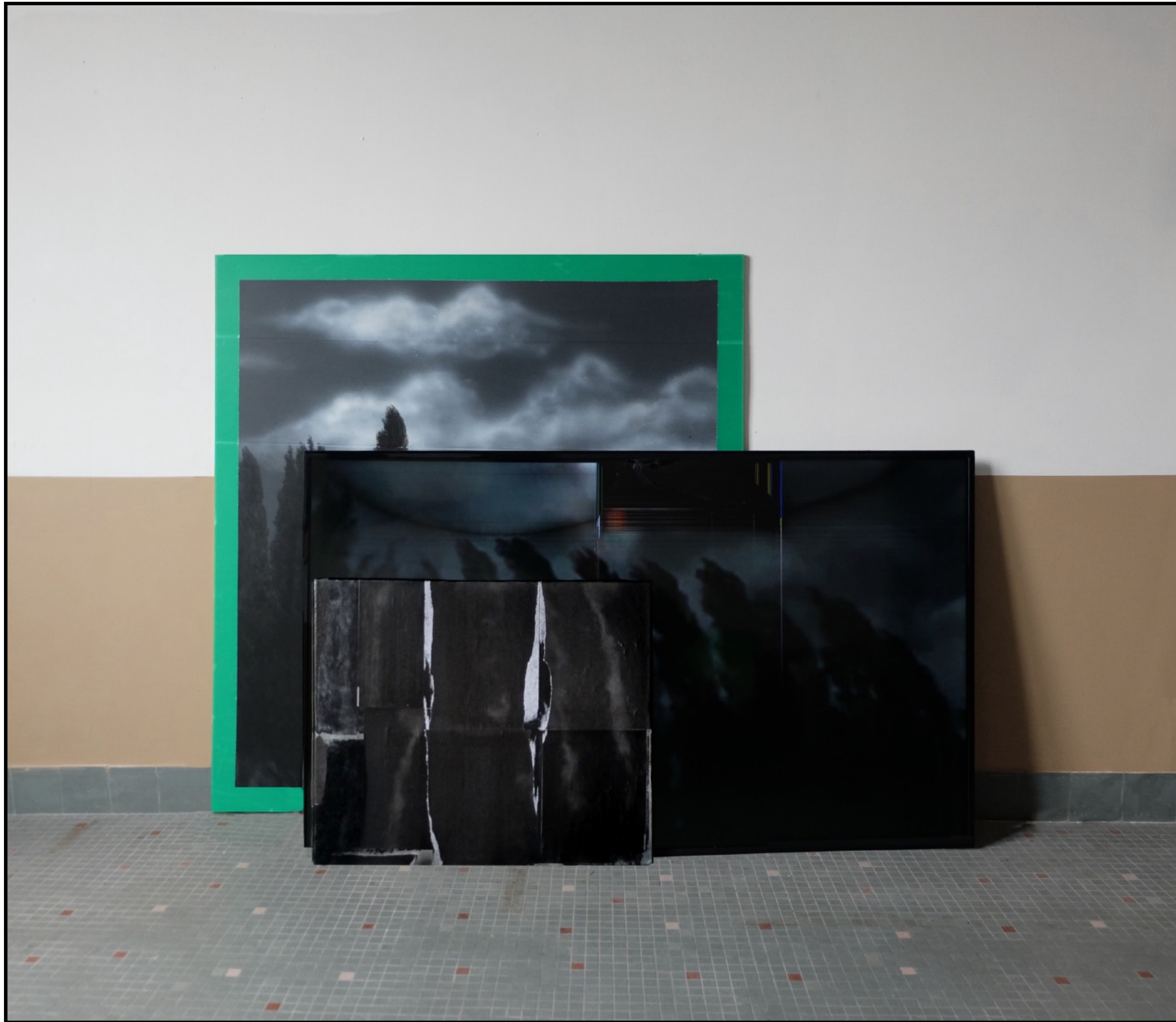
Eglogues #4 Peinture acrylique sur polycarbonate, écran et impressions encollées sur toile (120 x 142 cm) 2022

Vue de l'exposition L'horizon des événements (solo show à La Villa Balissade, février 2022)