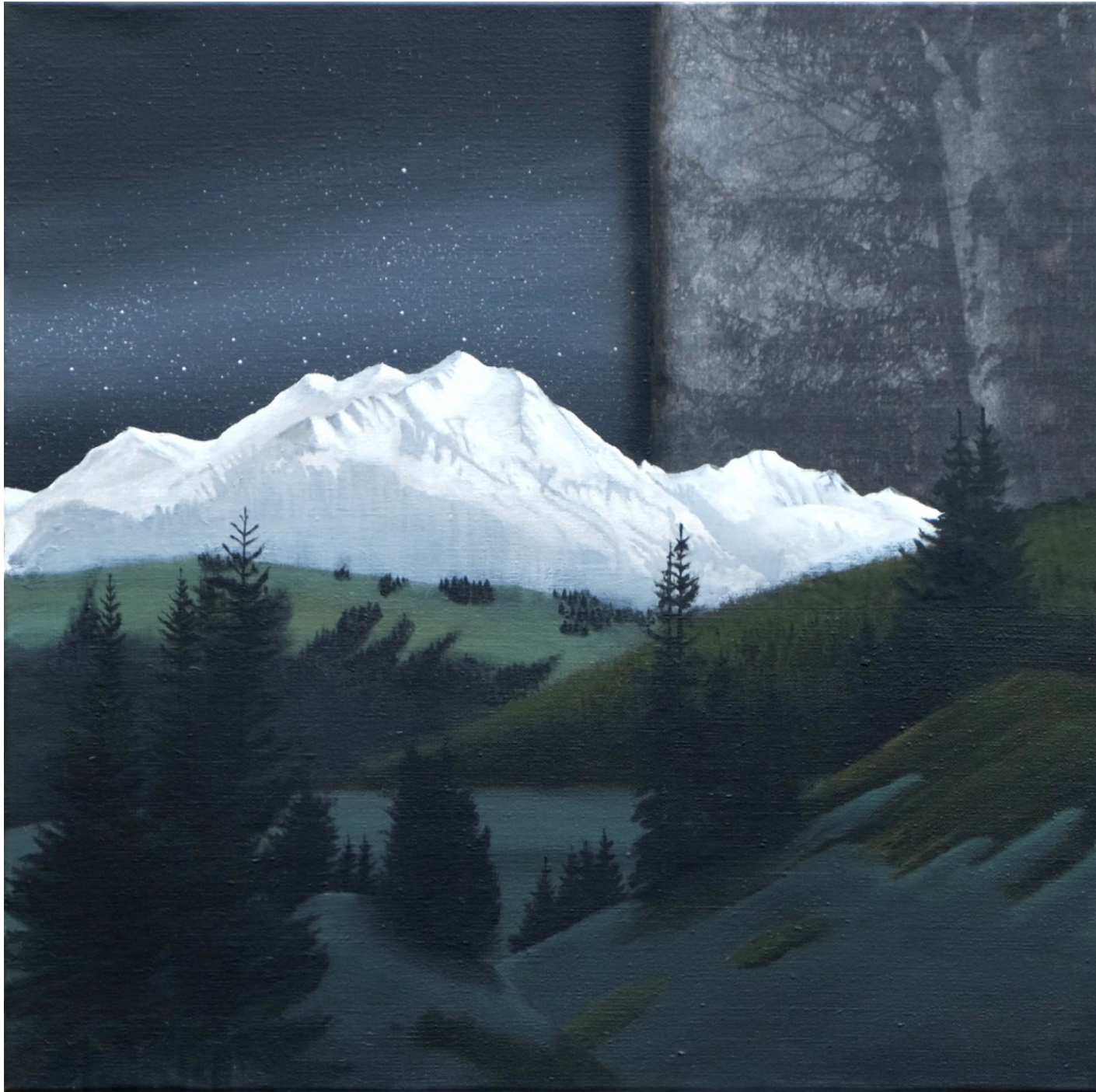
Lieux #1 Acrylique et transfert d'impression sur toile (50 x 50) 2022

Je me suis inspiré pour cette série du pictorialisme, mouvement esthétique qui revendiquait la dimension artistique de la photographie et cherchait à estomper la frontière entre photographie et peinture. Dans cette idée, je juxtapose au sein de chaque toile des photographies transférées et des paysages peints. Ces juxtapositions conduisent à la cohabitation du jour et de la nuit, de différents rendus et de différents lieux.