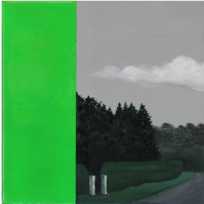
pays4g+s #15 Acrylique et résine epoxy sur toile (30 x 30 cm) 2020

La série « pays4g+s » est une exploration des supports et des médiums propres à la peinture. L'idée est de confronter les matières (peinture, résine, aérosol) et de mettre en jeu des tensions entre abstraction et figuration, vide et plein, terne et vif, brillant et mat, .... Ici, les paysages ne sont qu'une modalité formelle au même titre que l'aplat.