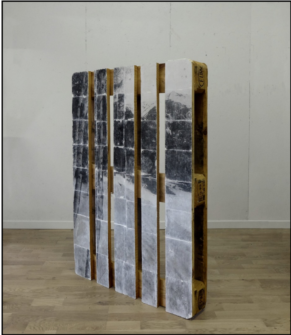
fake mountain view #6 Photomontage, impression sur palette (120 x 100 cm) 2021 Vue d'atelier