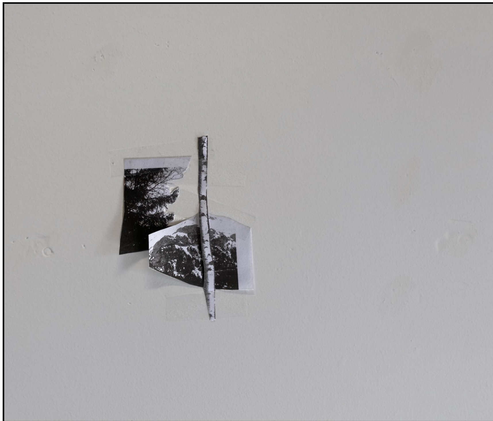
fake mountain view #1 Collage scotché à un mur (5 x 8 cm) 2022 Vue d'atelier

Dans la série Fake mountain view , la même photo est retouchée numériquement et reproduite sur différents supports et grâce à différents médiums.