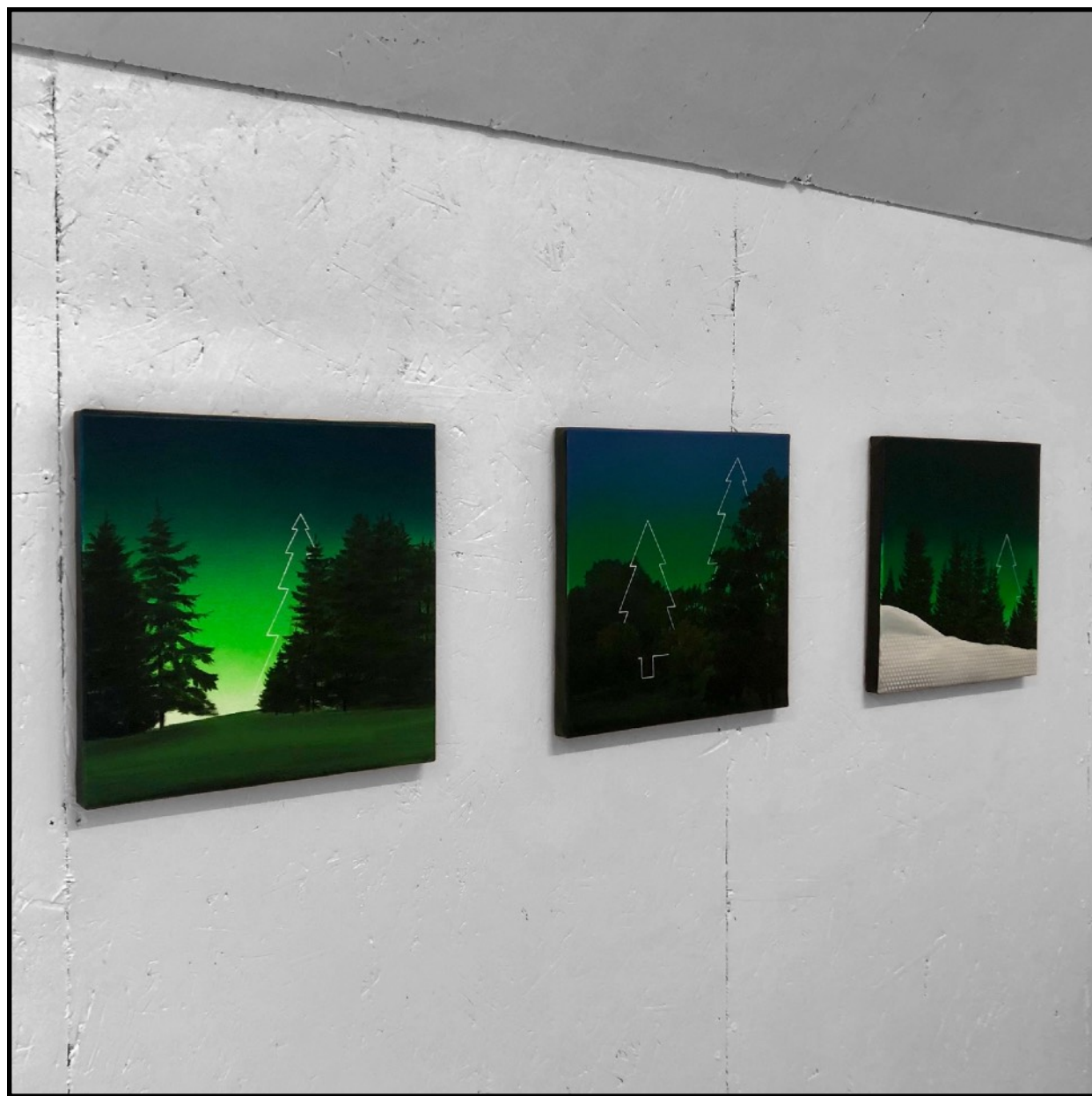
okashisa #1, #15 & #12 Acrylique sur toile (30 x 30 cm) 2020 vue d'atelier