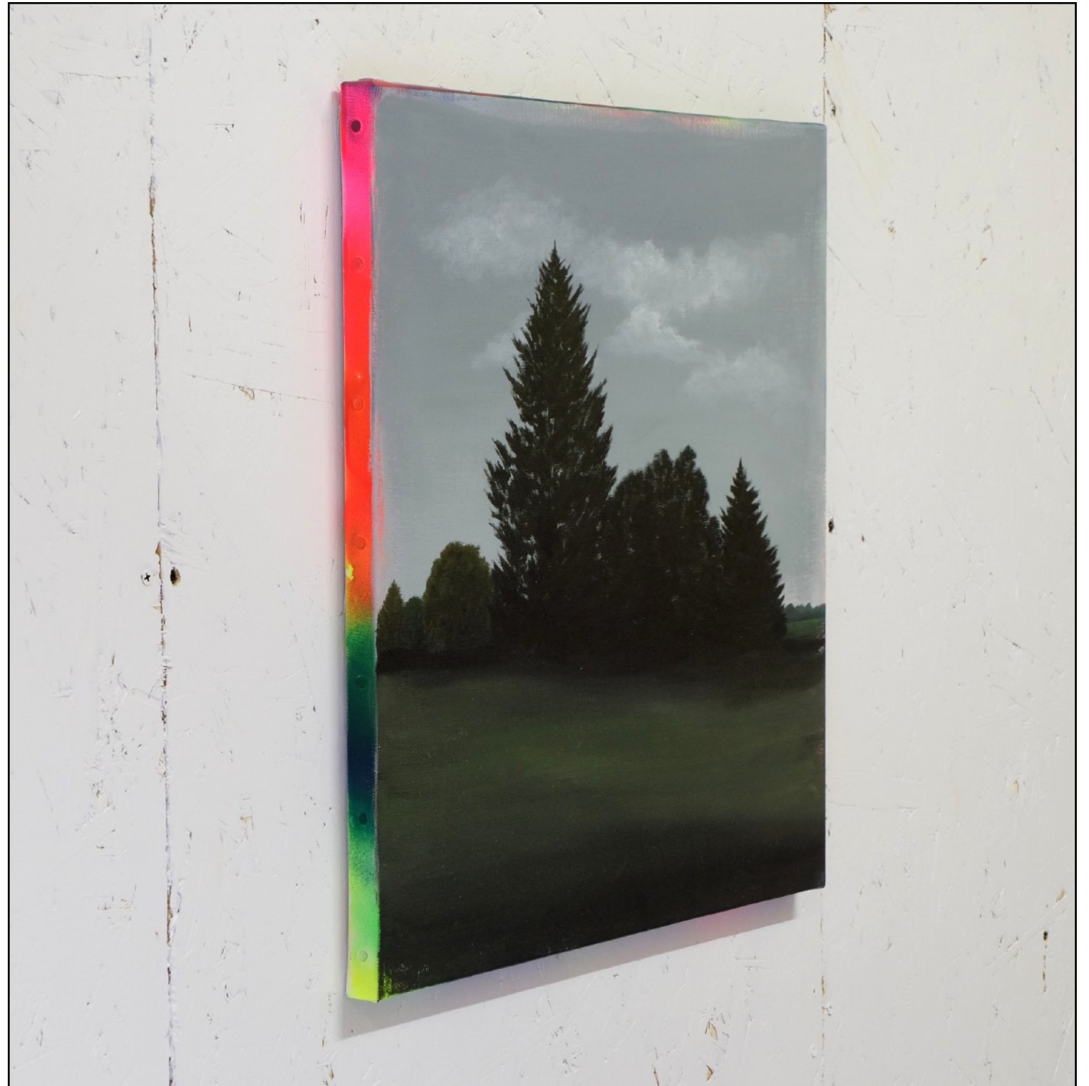
pays4g+s #4 Peinture acrylique sur toile (50 x 50 cm) 2020 Vue d'atelier