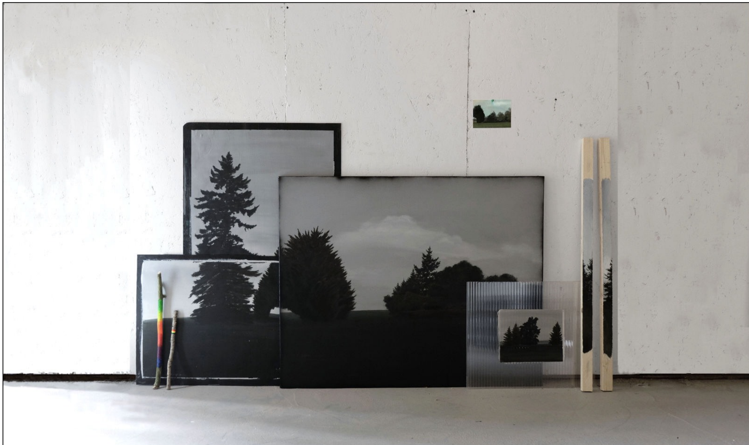
Eglogues #2 Peinture acrylique sur matériaux divers (polycarbonate, toile sur châssis et tasseaux) et photographie punaisée au mur (107 x 148 cm) 2020 Vue d'atelier