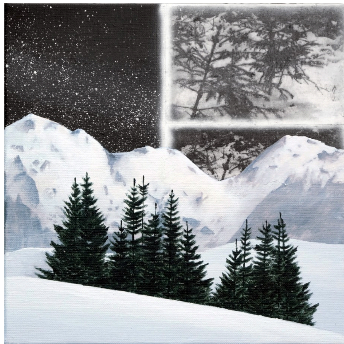
Lieux #2 Acrylique et transfert d'impression sur toile (30 x 30) 2023