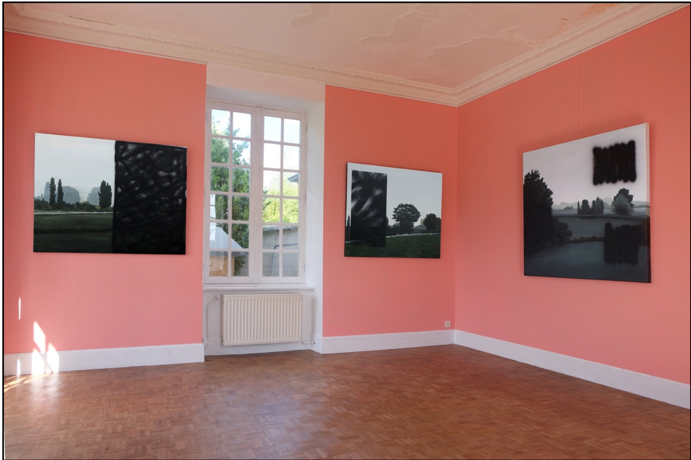
Matière noire #1, #2 et #3 Acrylique sur toile (100 x 120 cm, 100 x 120 cm, 120 x 120 cm) Vue de l'exposition L'horizon des événements (solo show à La Villa Balissade, Beaussais-Sur-Mer, février 2022)