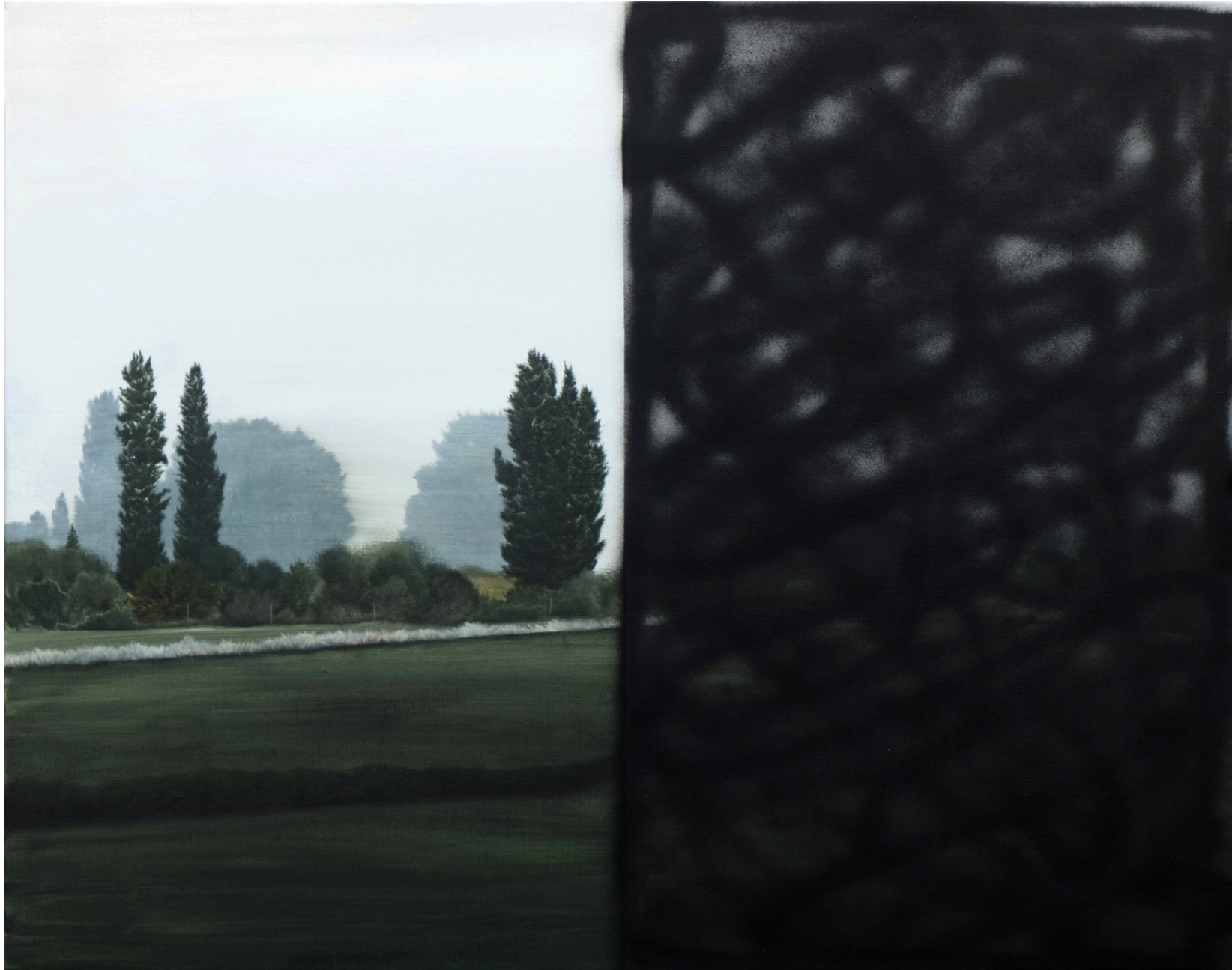
Matière noire #1 Acrylique sur toile (100 x 120cm) 2022

Cette série met en scène un double procédé de dévoilement et d'oblitération du paysage peint et confronte deux temporalités, le procédé long et minutieux de la peinture et les quelques secondes nécessaires au recouvrement. Cette façon dont le paysage est saccagé, vandalisé par une matière noire rappelle comment les hydrocarbures agissent négativement sur la biodiversité, compromettent notre survie mais aussi, plus prosaïquement, détériore nos paysages vernaculaires.