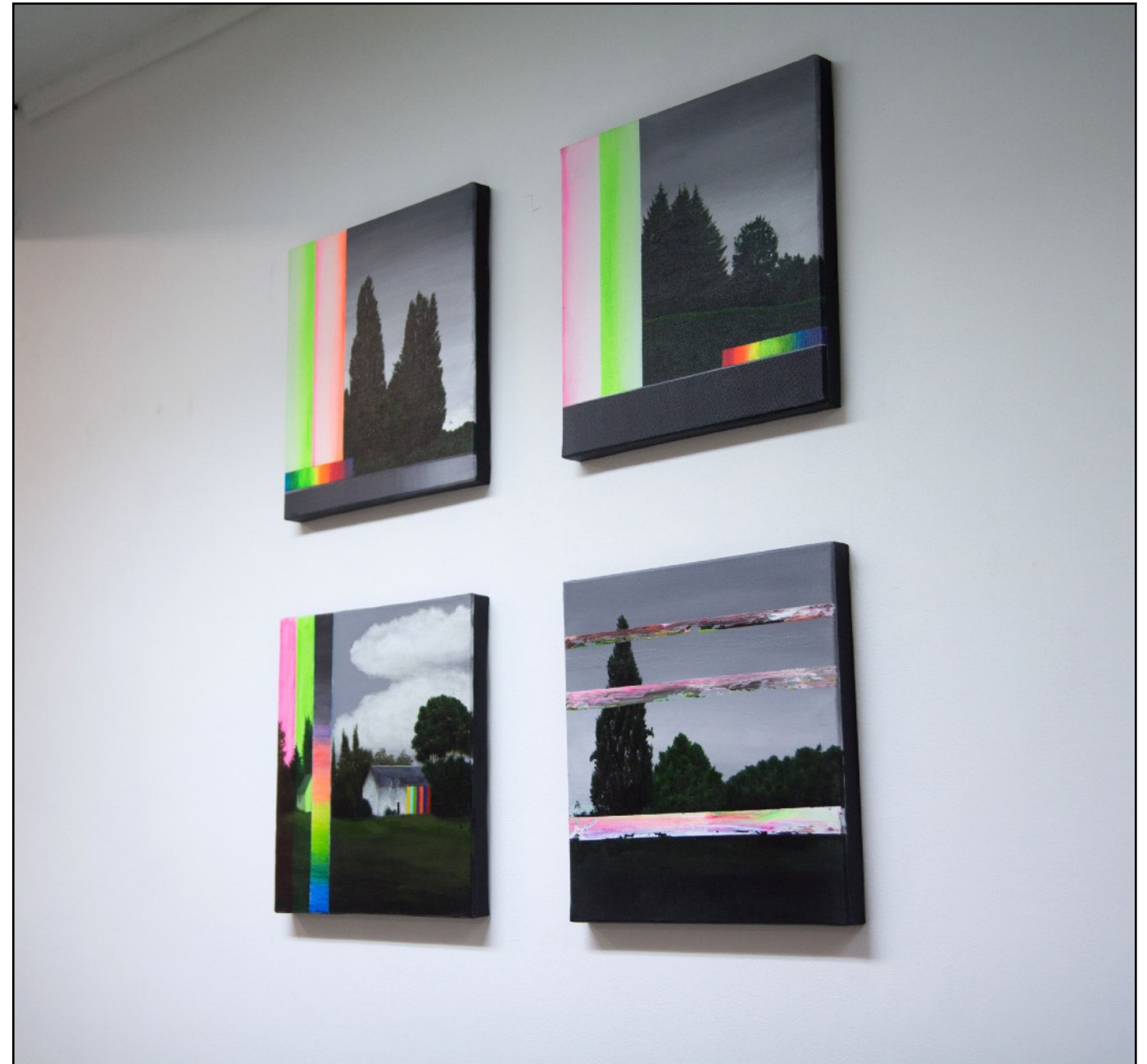
Ecran #14, #15, #16 & #19 Acrylique sur toile (30 x 30 cm) 2019

Vue de l'exposition Nature? (duo show à la Galerie Tracanelli, octobre 2019)