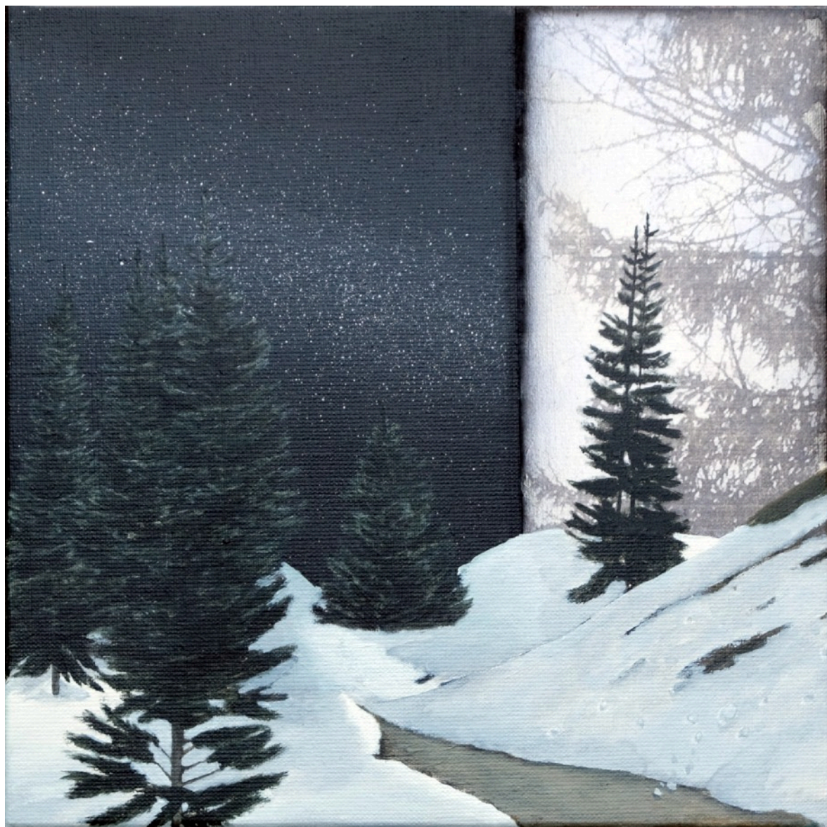
Lieux #10 Acrylique et transfert d'impression sur toile (30 x 30) 2023