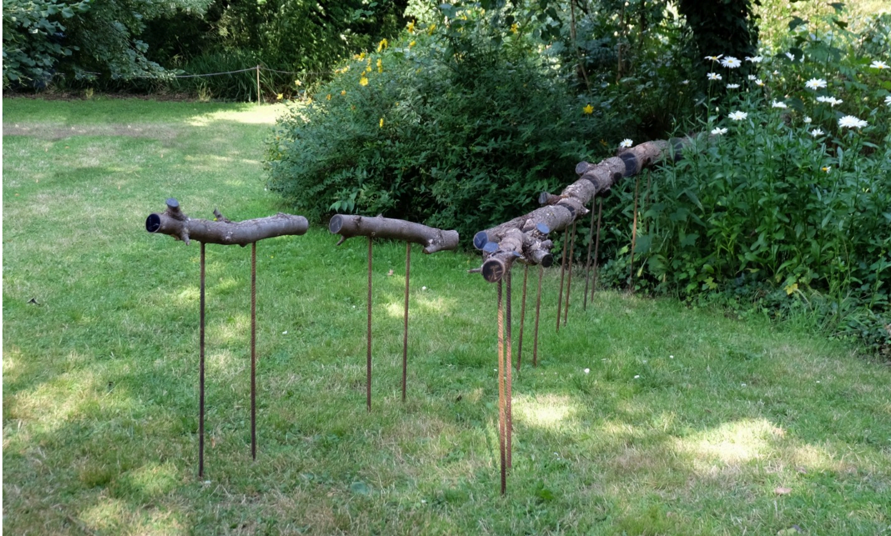
L'éclaté bois, transfert d'impression, fusain et gravure, dimension variable 2024