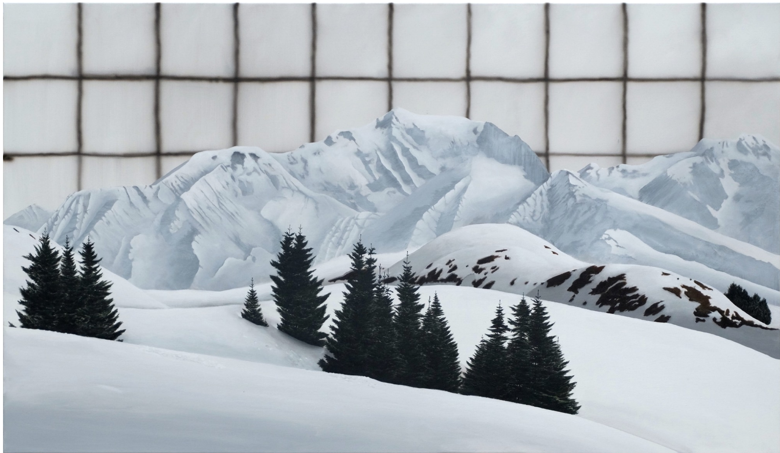
okashisa #43 Acrylique sur toile (120 x 200 cm) 2022