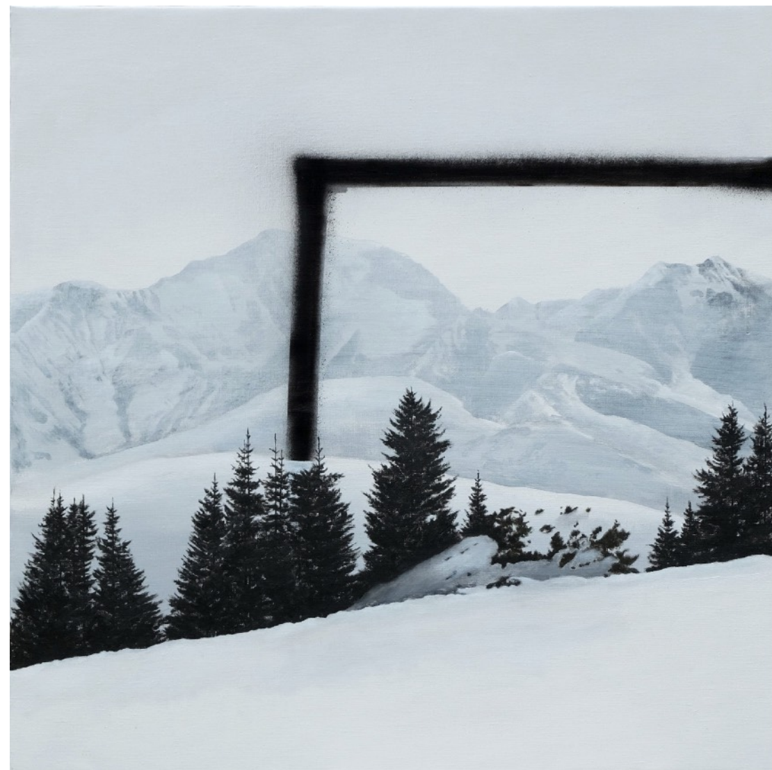
okashisa #35 Acrylique sur toile (80 x 80 cm) 2020