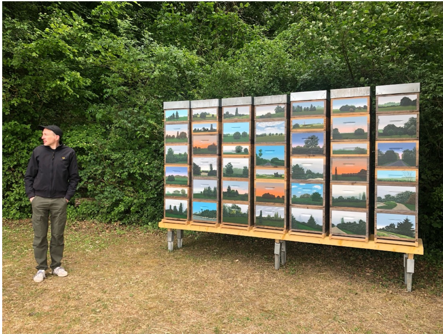
3 km de rayon Peinture acryliques sur 42 corps de ruche Vue de l'exposition Vign'art 2025 2025