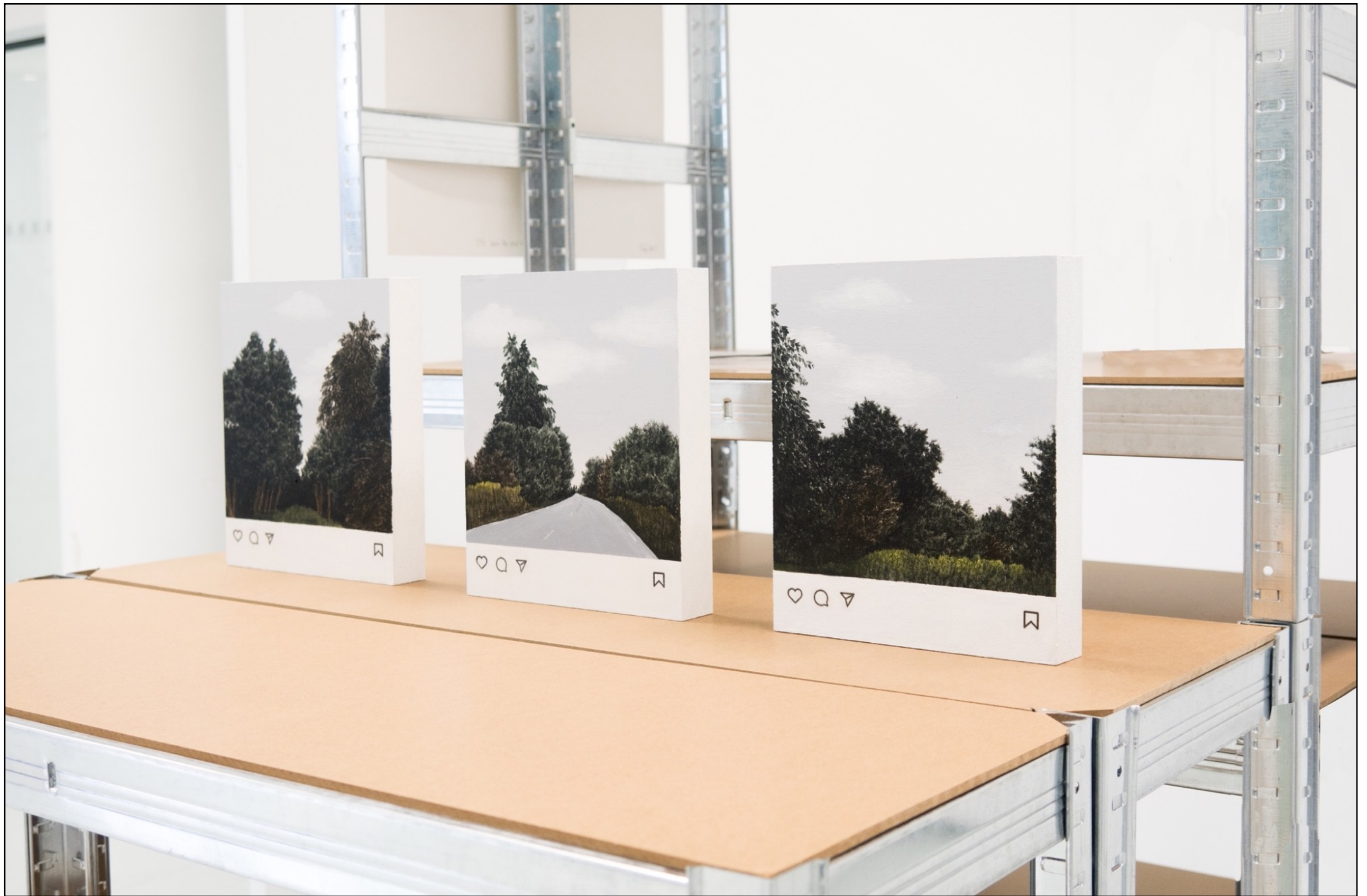
10 000 likes Peinture acrylique et transfert d'impression sur médium, 20 x 24 x 4 (triptyque), 2023 Vue de l'exposition Textes/lettres/signes , bibliothèque universitaire Droit lettres de GRENOBLE, mars 2023