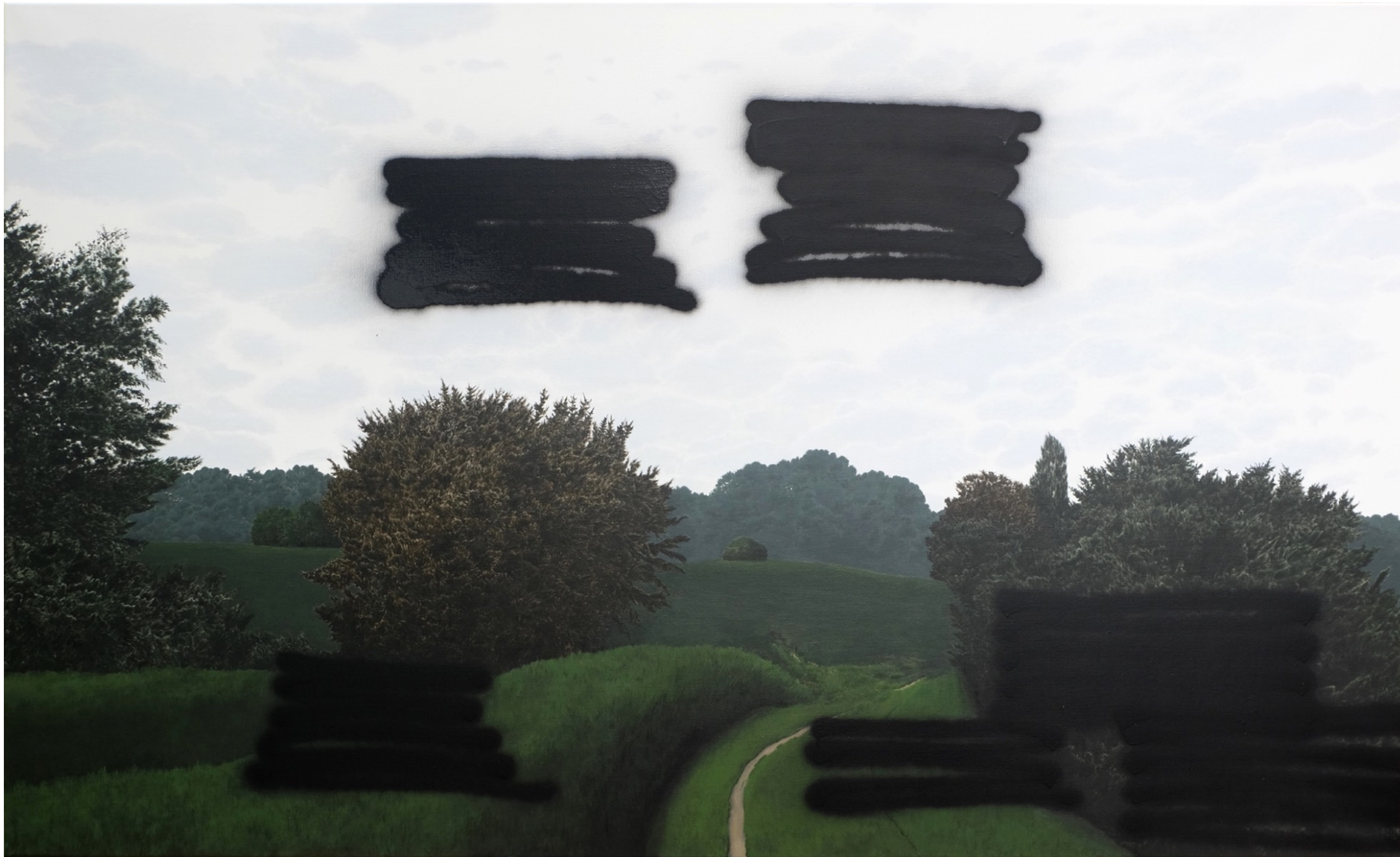
Matière noire #5 Acrylique sur toile (120 x 200cm) 2022