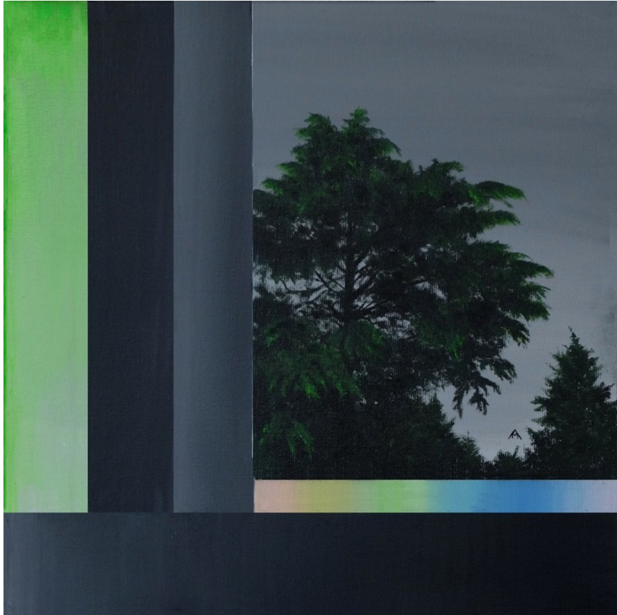
Ecran #20 Acrylique sur toile (30 x 30 cm) 2019

Le tableau figuratif est traditionnellement conçu comme une fenêtre. Par la suite, le téléviseur est devenu la fenêtre par laquelle on regarde le monde. Les toiles de la série "écrans" synthétisent ces deux fenêtres, en combinant images de paysages et signes visuels appartenant à l'univers des écrans. Ces signes visuels sont les éléments laissant apparaître le fonctionnement de ces écrans (mires permettant d'étalonner les couleurs du monde, parasites déconstruisant le paysage).