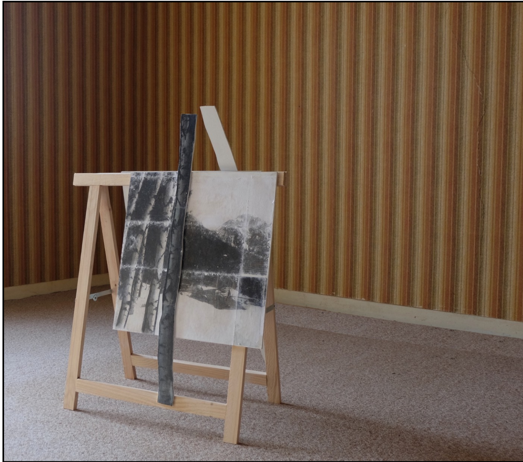
fake mountain view #4 Tréteau, bois et impression (95 x 65 cm) 2022 Vue de l'exposition L'horizon des événements (solo show à La Villa Balissade, février 2022)